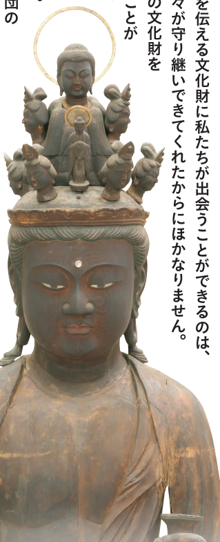
重要文化財 《木造十一面観音立像》 鎌倉 文永5年(1268) 長岡京市・乙訓寺蔵 【Ⅰ・Ⅲ期】

先人の文化や思想を伝える文化財に私たちが出会うことができるのは、これまで多くの人々が守り継いでできてくれたからにはほかありません。次の世代へつなぐことができるかどうかは、今の私たちに懸かっていると、言い換えられます。本展では、住友財団の助成事業によって修理が完了した文化財をご紹介します。美しくよみがえった文化財の裏側にある最新の修理技術や、修理に奔走した人々の熱意にスポットを当てて、文化財修理の意義とこれからの考えを語ります。