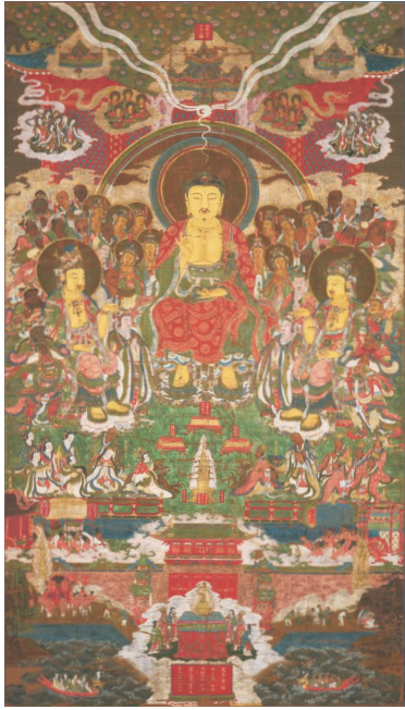
重要文化財 李晟筆《弥勒下生变相図》 高麗・忠烈王20年(1294) 京都市・妙満寺蔵【Ⅱ期】

「住友財団とは」住友財団は、1991年創立以来、人類共通の宝である文化財を後世に伝えることを現代人の責務と考え、文化財維持修復事業の助成につとめてきました。民間の立場から、国内と海外の文化財を対象に1400件を超える助成を続けてきました。