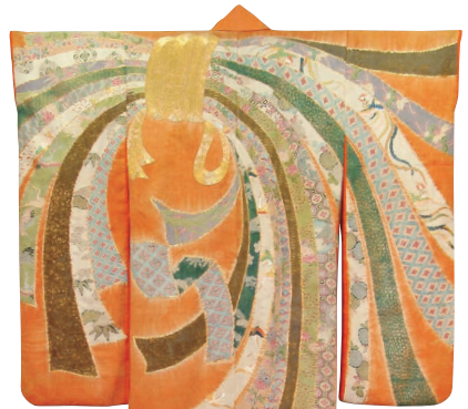
重要文化財 《紅羅織地刺斗文友禅染振袖》 江戸時代18世紀 京都市・友禅史会蔵 【Ⅲ期】