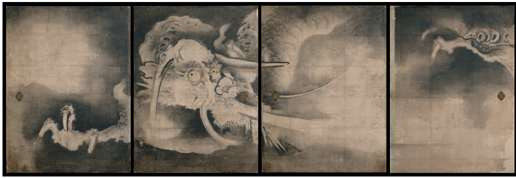
河北友重筆 母陀院本堂障壁画(雲龍圖) 江戸時代17世紀 京都市・藤祥院蔵(場面替えあり)