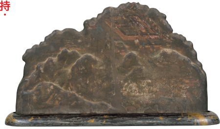
京都府指定文化財《宝珠台》鎌倉～南北朝時代 14世紀 木津川市・海住山寺蔵【1期】