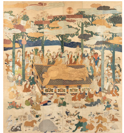
《繻子地刺繍仏涅槃図》江戸・元禄4年(1691) 京都市・三寶寺蔵【1期】