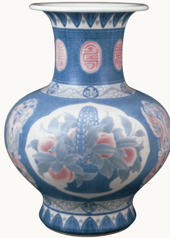
板谷波山《葆光彩磁珍果文花瓶》1917(大正6)年 当館蔵