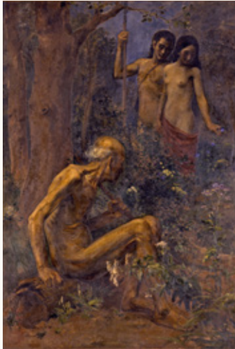
中村不折《白頭翁》1907(明治40)年