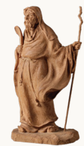
山崎朝雲《竹林の山濤》1912(大正元)年 当館蔵