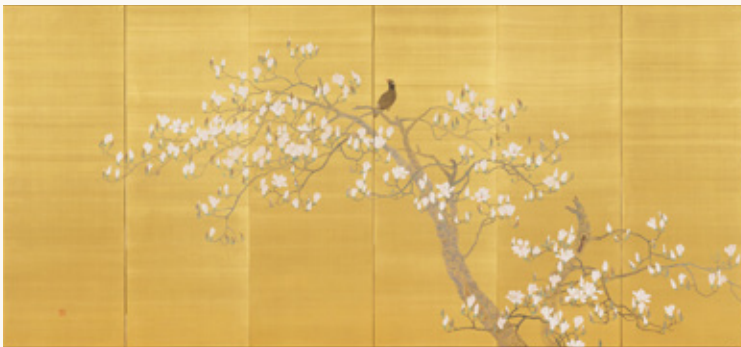
尾竹竹坡《九冠鳥》1912(明治45)年 当館蔵【後期展示】