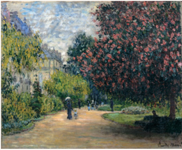
クロード・モネ《モンソー公園》1876年 当館蔵