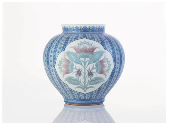
板谷波山《葆光彩磁珍果文花瓶》大正後期 廣澤美術館蔵

入 館 料 一般1,200円 高大生800円 中学生以下無料 *20名以上は団体割引料金(一般1,000円、高大生700円) *障がい者手帳ご呈示の方は無料