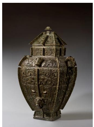
饗饗文方壘 殷後期・前12-11世紀