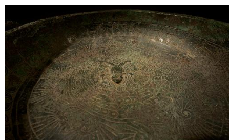
蛙蛇文盤 春秋前期・前8-7世紀

さまざまある青銅器の種類とその用途をテーマに紹介。不思議な形をしている中国青銅器に定められた、食器・酒器・水器・楽器という4種類の用途を中心にデジタルコンテンツを応用した動画をまじえ当時の使い方をお伝えします。