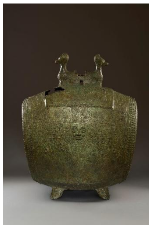
夔神鼓 殷後期・前12-11世紀

中国青銅器の基礎的な知識に関する解説を付し、古代へと旅するためのイントロダクションとします。