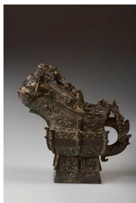
ゲン兕觥 西周前期・前11世紀