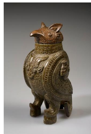
鷓鴣尊 殷後期・前13-12世紀