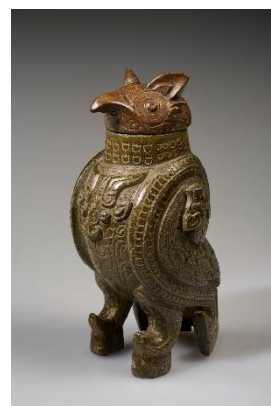
鷓鴣尊 殷後期・前13-12世紀