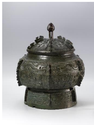
饗饗文有蓋甗 殷後期・前11世紀