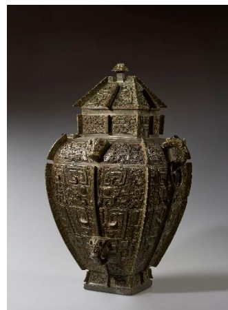
饗養文方罍 殷後期・前12-11世紀