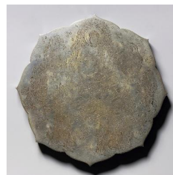
線刻仏諸尊鏡像 平安・12世紀 国宝