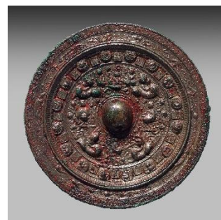
画文帯同向式神獸鏡 後漢末-三国・3世紀 重要文化財