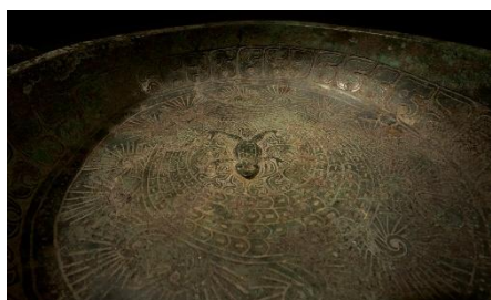
蛙蛇文盤 春秋前期・前8-7世紀