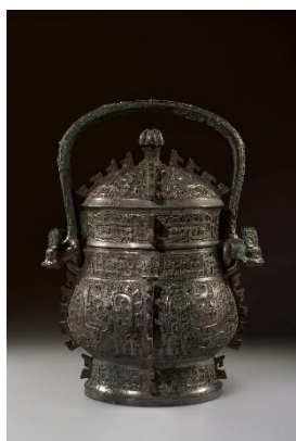
見貞 西周前期・前10世紀