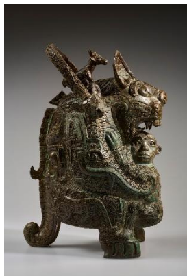
虎貞 殷後期・前11世紀