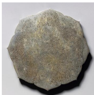
線刻仏諸尊鏡像 平安・12世紀 国宝

ここでは、東アジアに広く受容された鏡を中心として、日本を含む周辺地域の青銅器も取り上げつつ、青銅文化の展開を見ていきます。