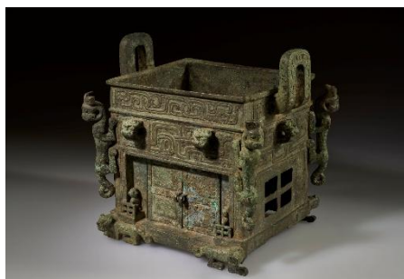
蟻文方炉 春秋前期・前8世紀