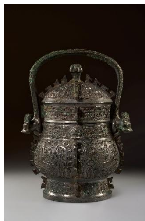
見卣 西周前期・前10世紀