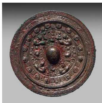
画文帯同向式神獸鏡 後漢末-三国・3世紀 重要文化財