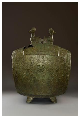
夔神鼓 殷後期・前12-11世紀